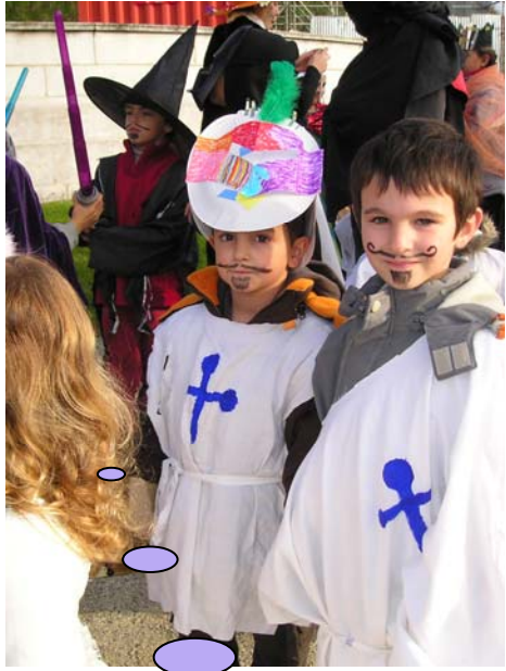
Et des chevaliers courageux