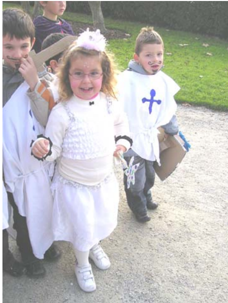
De belle princesses